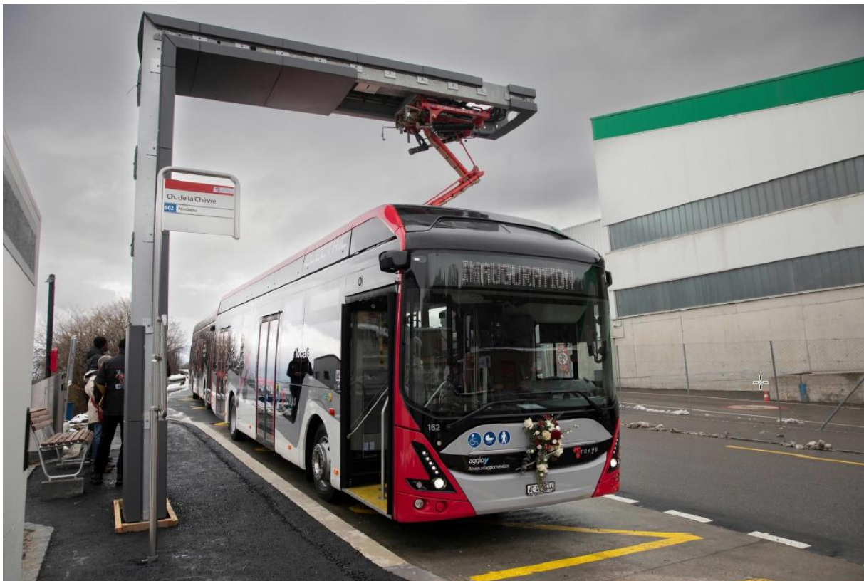
Exemple - Terminus de la ligne 202 à Yverdon

Il sera toutefois nécessaire d'injecter un véhicule supplémentaire sur chaque ligne pour garantir un temps de recharge suffisant.