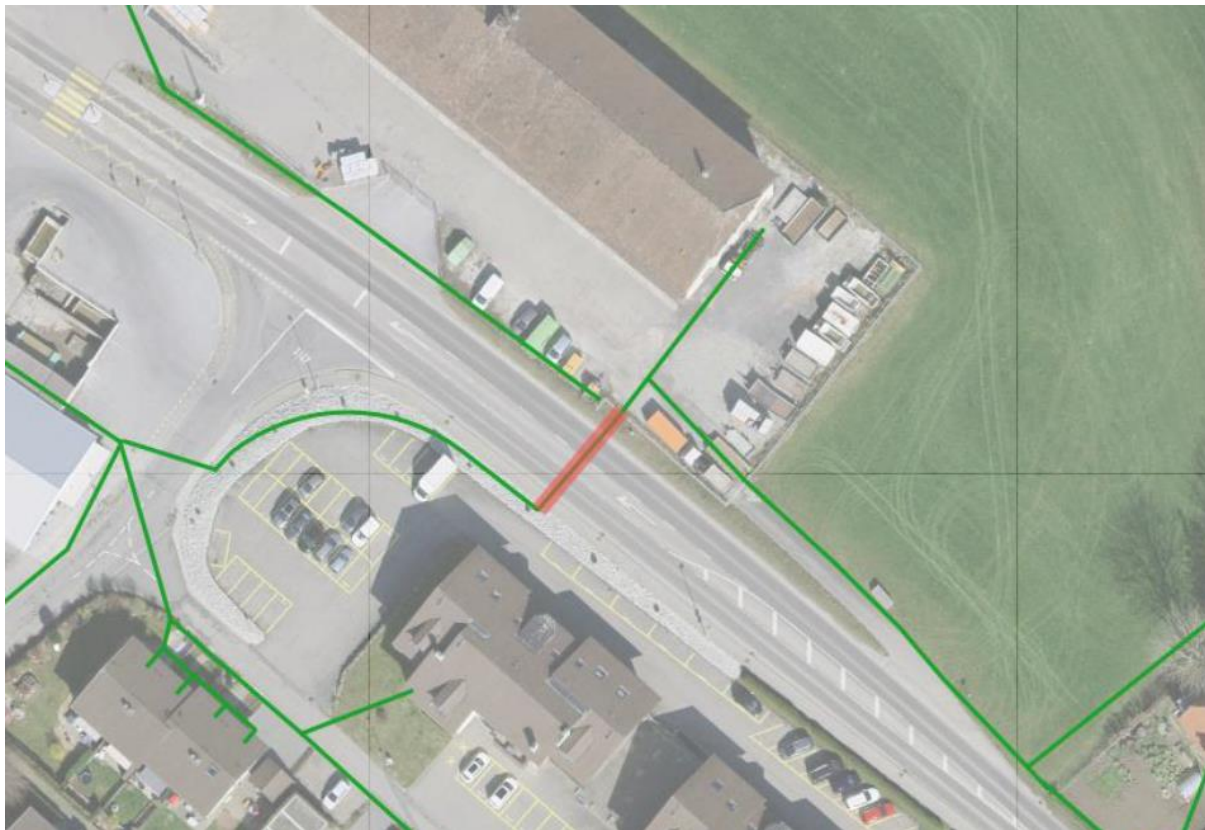
Situation de la conduite EP concernée

La conduite d'eau potable communale (diamètre 125mm, en fonte), située sous la route cantonale dans le secteur du Dally à Vuadens, s'est fissurée durant les travaux de réalisation des arrêts de bus. Une réparation par collier a eu lieu sur le moment, mais la conduite est fragilisée et peut se rompre à tout moment.